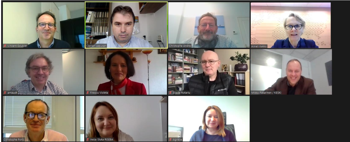
Le comité de pilotage du projet PROCESS